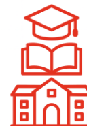
Wszystkie poziomy edukacyjne (dla osób przygotowanych do nauczania w całym cyklu kształcenia)