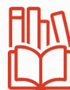
Biblioteki pedagogiczne i szkolne